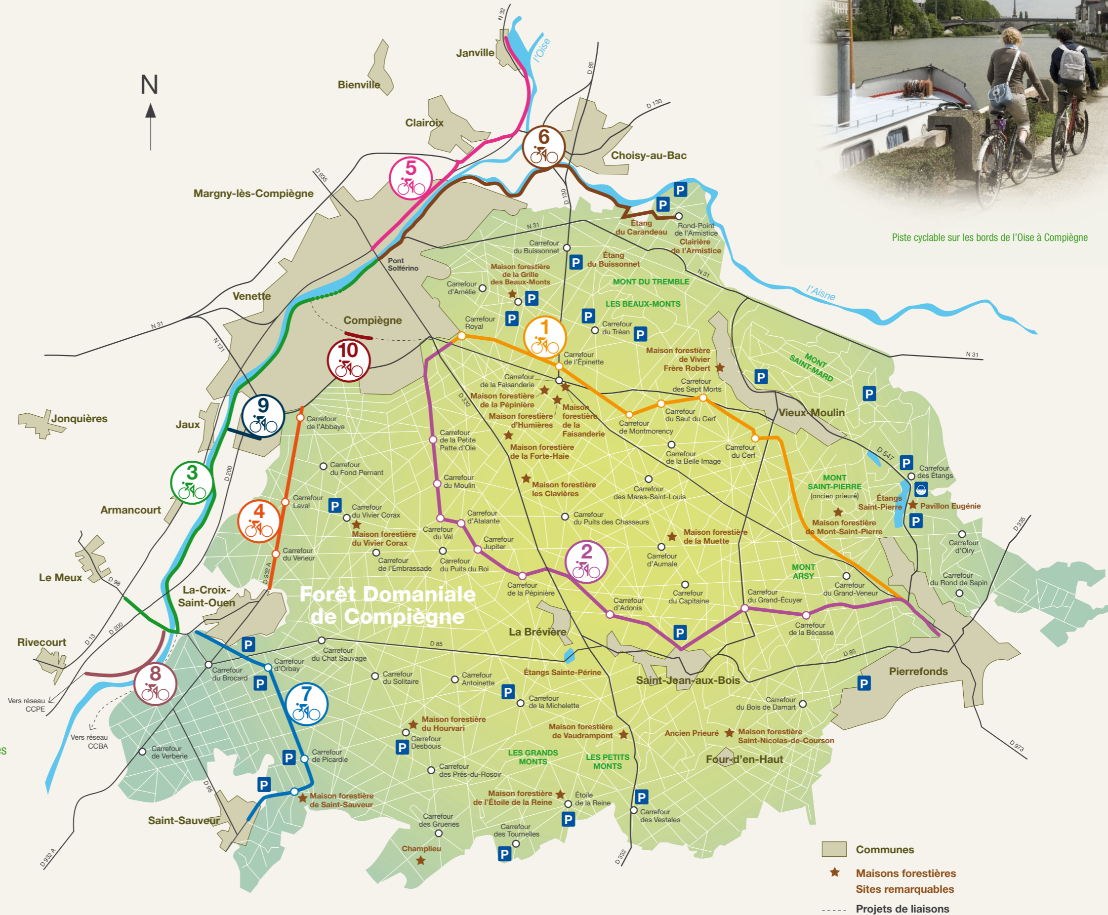
Piste cyclable sur les bords de l'Oise à Compiègne